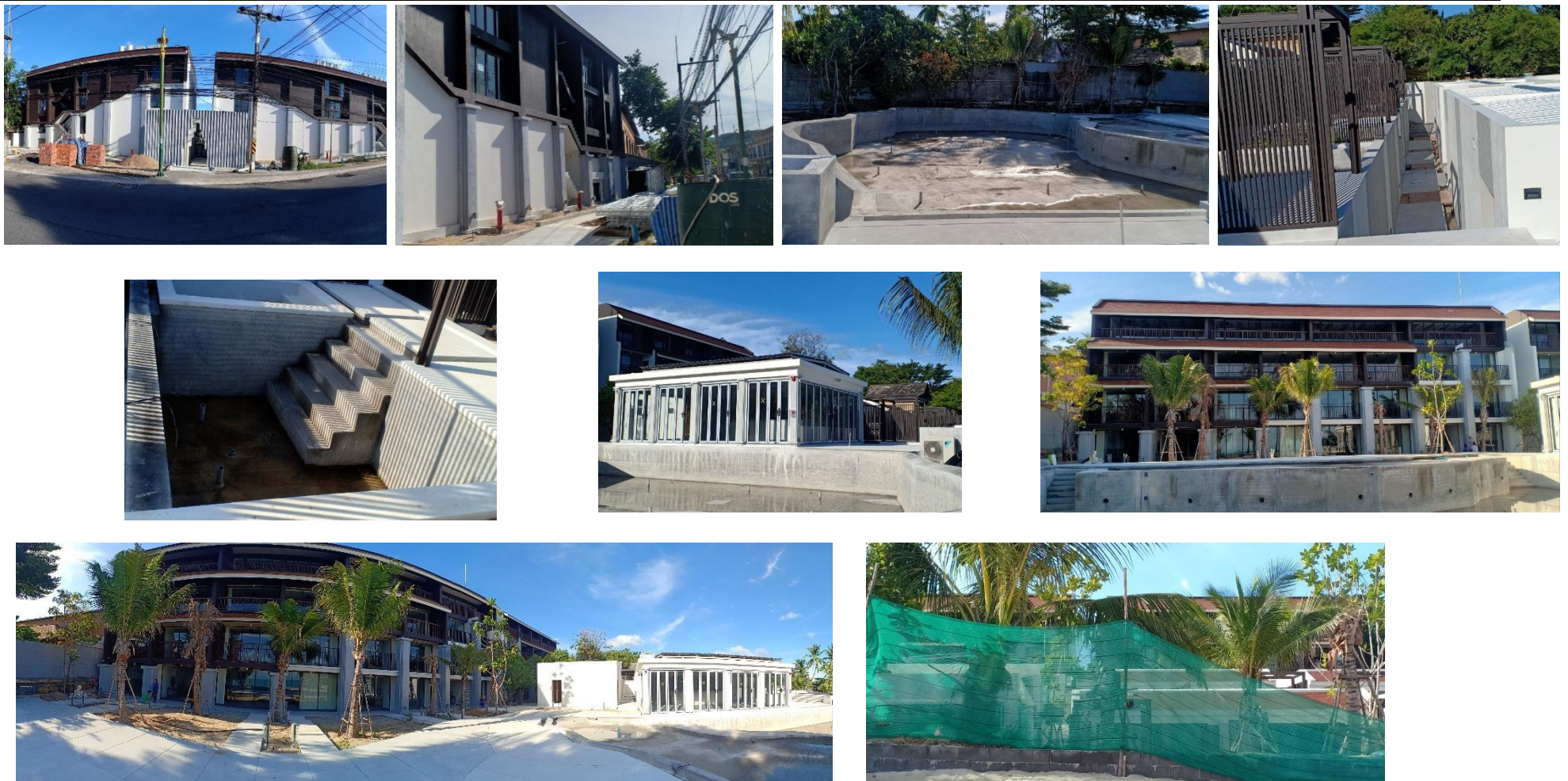
รูปที่ 1.2-3 สภาพพื้นที่โดยรอบโครงการ