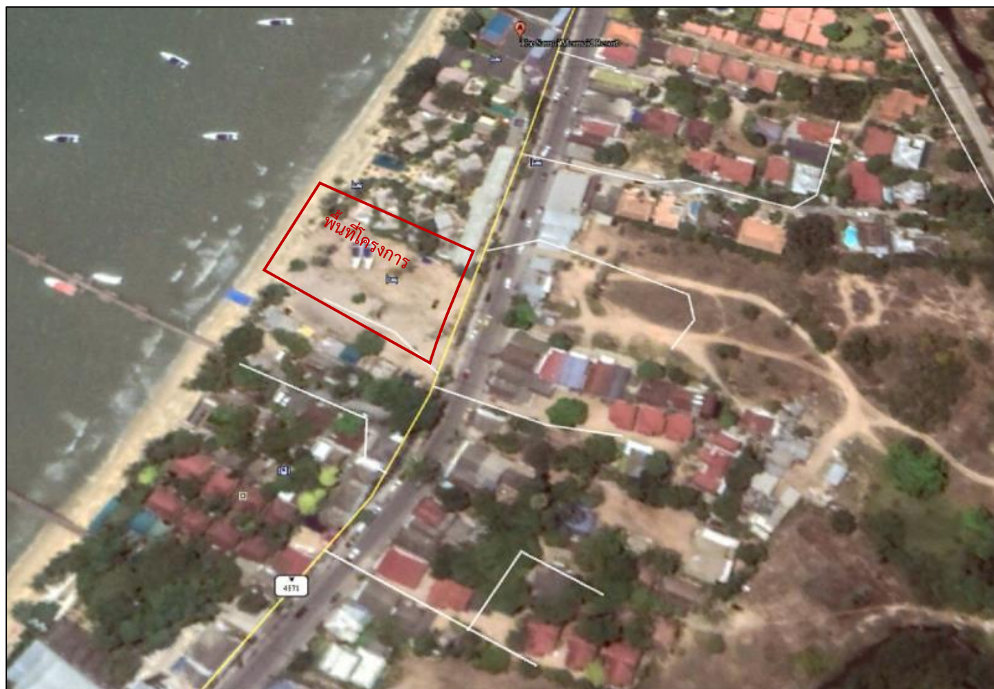
รูปที่ 1.2-1 ที่ตั้งของโครงการ